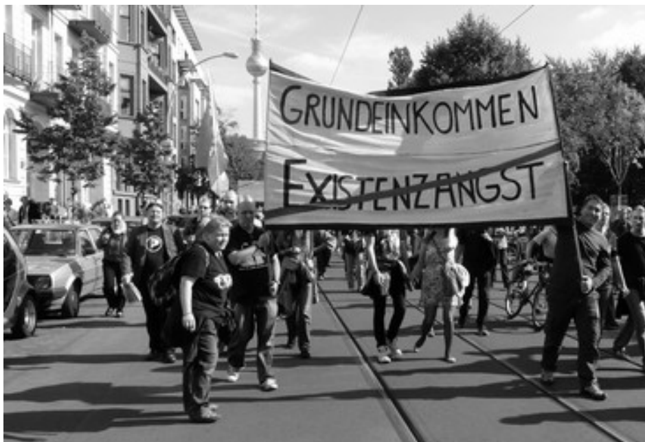
Paris

EM: Das Besondere an diesem Antrag war, dass es nicht nur grundsätzlich ein Antrag für das BGE war, sondern dass auch die Höhe des BGE genau festgelegt wurde. Weil – ich zitiere jetzt mal Brecht: Man kann einen Menschen auf vielerlei Weise umbringen, man kann ihm keine Wohnung geben, man kann ihm zuwenig zum Leben geben, man kann ihn auch direkt erschießen. Und wie sagte Brecht so weise: Nur wenig ist in diesem Land verboten. Und ein BGE hat nur Sinn, wenn es wirklich die Existenz garantiert, nicht auf dem Minimum, sondern etwas darüber, damit die Teilhabe an der Gemeinschaft gesichert ist.