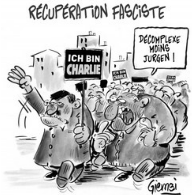
"Faschistische Instrumentalisierung" mit der Sprechblase "Halt dich etwas zurück, Jürgen"