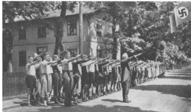
„Flaggengruß“ der Christianschule. In diese Postkarte, die die Loyalität zum NS-Staat demonstrieren sollte, wurde die Hakenkreuzfahne nachträglich hineinmontiert. Die konfessionelle Schule wurde unter dem Vorwurf der politischen Unzuverlässigkeit 1939/40 geschlossen.

Interessanterweise war trotzdem keiner der drei während der Jahre 1933 – 1945 amtierenden Missionsdirektoren Mitglied der NSDAP, auch von den 25 Mitgliedern des Missionsausschusses war lediglich einer, der Leiter der staatlichen Hermannsburger Volksschule, Parteimitglied. Für das Kollegium des Missionsseminars und der Christanschule konnte Schendel fünf NSDAP-Mitgliedschaften belegen, und damit ein dem Reichs-